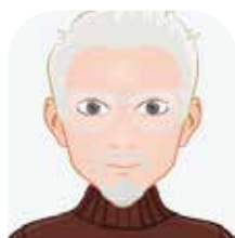
Le Président Patrick MIESCH

Budget, achat/marchés publics, gestion de la redevance incitative, prévention/communication, plan régional des déchets